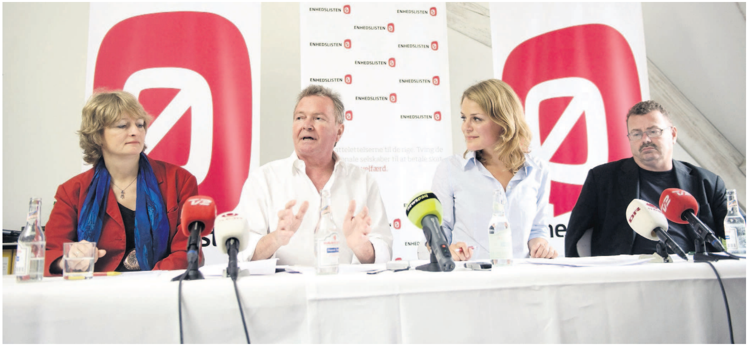
Enhedslisten har fundet en niche i miljø- og klimapolitik, og det har partiets vælgere det god med. Fra venstre Line Barfod, Frank Aaen, Johanne Schmidt-Nielsen og Per Clausen.

Vælgertække. Alle partier har deres kæpheste. Det giver dem en styrkeposition i forhold til egne vælgere, men kan også være til fordel for modstanderne.