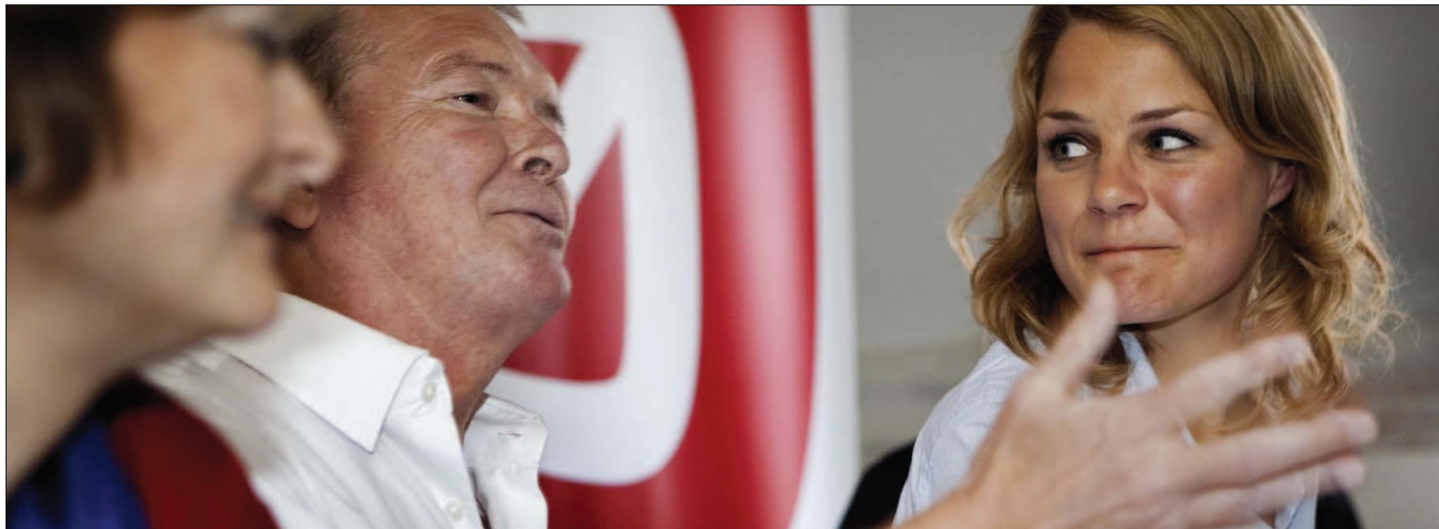
MEMLEMSMAGNET. Partiernes medlemstal har været i frit fald, siden de gamle partier toppede i begyndelsen af 1960'erne. Nogle af de nye partier har imidlertid haft stor succes med at rekruttere nye medlemmer i 00'erne.